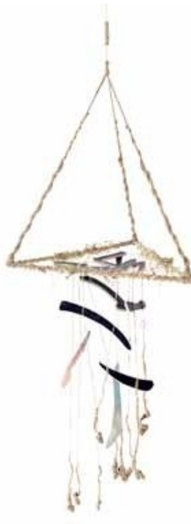
"JIA"(흙), 70x60x200cm, 2024년