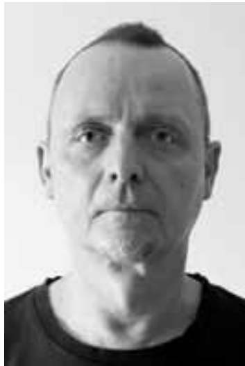
Somnia, 종이에 디지털 프린트, 14 x 100cm, 2024, 사진 및 포스트 프로덕션 by Tereza Samková