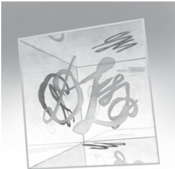
파라피, 인그레이빙 플렉시글라스, 21x21cm, 2024

체코 비로베츠 인근 브르제시나에서 거주하며 작업하고 있습니다. 1970년대 후반부터 그녀의 작품은 개념적인 성격을 띠고 있습니다. 1989년부터 개인전을, 1981년부터 단체전을 열었습니다. 1991~2012년에는 오스트라바 대학교 페다고지 학부 미술교육학과에서 근무했습니다. 그녀는 특히 개념주의 분야에서 시각 예술의 중재를 다루었습니다. 현재 그녀는 예술 창작, 교육 및 큐레이터 활동에 종사하고 있습니다.