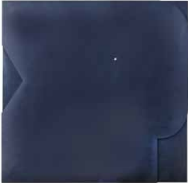
모노그램 "KP", 나무에 고무, 스와로브스키 크리스탈, 36,5x36x4 cm, 2024년