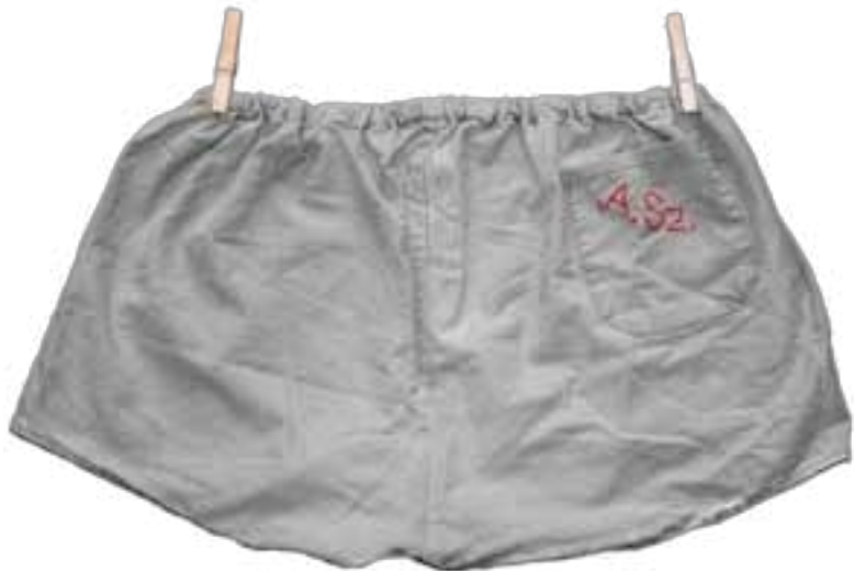
모노그램, 50x30w cm, 2024년

1993년부터 낭만주의 예술 협회 "ROMAN"(Pavel Preisner, Michal Navrátil) 회원, 1995년부터 올로모우츠 예술가 협회 회원입니다. 팔라츠키 대학교 교육학부에서 미술 교육을 전공했습니다. 올로모우츠에서 태어났습니다. 수년에 걸쳐 그의 자유 회화 작업은 타시즘적 요소를 가미한 서정적인 추상화부터 어린이를 표현한 형식적인 회화, 표현적인 방식으로 실행된 기하학적 추상화에 이르기까지 다양합니다. 다양한 매체에 대한 상당한 실험을 통해 그의 작품은 거의 항상 개념적인 작품으로 분류할 수 없습니다. 이러한 개념은 전시된 오브제의 실제 설치가 중요한 역할을 하는 전시 프레젠테이션에서도 분명하게 드러납니다. 또한 그는 나무에서 에폭시 레진에 이르기까지 자유로운 조각 작업을 하고 있습니다. 최근 몇 년 동안 그는 발견되거나 인위적으로 만들어진 다양한 요소를 사용하여 약간 아이러니한 의미의 구성으로 조합하는 조립 작업을 해왔습니다.