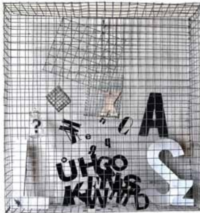
무제, 39x44cm, 2024년

그는 응용 그래픽, 특히 포스터 디자인과 프리랜서 작업에 전념하고 있습니다. 체스키테신의 포타 갤러리 큐레이터로 지난 10년 동안 체스키테신에 있는 AVION 문학 카페에서 전시 큐레이터로도 활동했습니다.