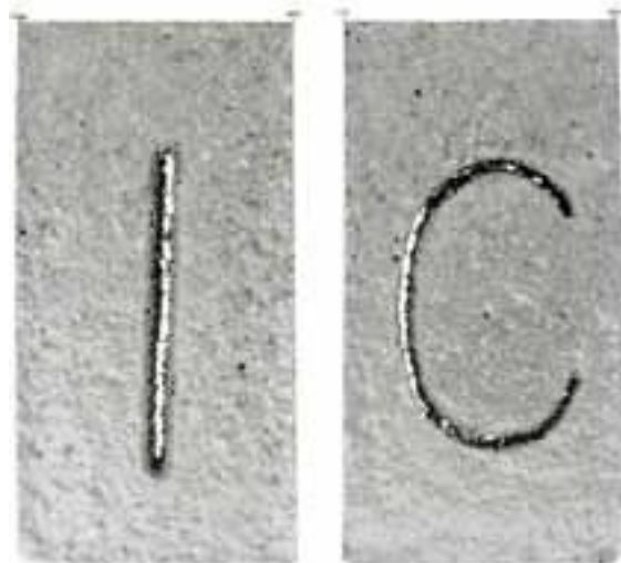
제목 없음, 폼 샌드 블라스트 유리, 30x60 cm, 2024

2005년에 발라슈스케 메지리지치 중등 예술 공예 학교를 졸업했습니다. 2006-2013년에는 유리 스튜디오의 doc. ak. mal. 얀 에반젤리스타 푸르키네 대학교 예술 및 디자인 학부의 일야 비렉(Ilja Bílek) 우스티나드 라뎀에서 공부했습니다. 공부하는 동안 그녀는 폴란드의 아카데미 오브 파인 아트 im에서 해외 인턴십을 마쳤습니다. 크라쿠프의 얀 마테이코(Jan Matejko)와 헝가리 페츠 대학교 음악 및 시각 예술 학부에서 인턴십을 마쳤습니다. 처음에는 콘크리트 작업과 유리와의 연결에 관심을 집중했습니다. 2010년부터는 공간 유리 오브제에 페인트를 롤로 발라 장식하는 작업을 꾸준히 해오고 있습니다. 현재 프로젝트에서는 광원을 사용하고 설치 예술을 지향하는 새로운 기술을 사용하여 작업하고 있습니다. 여기서 그는 집단 기억의 층을 추가하여 빛과 공간의 개념을 더욱 확장합니다.