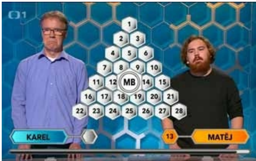
"칼, 대답할래? 아니," 캔버스에 디지털 프린트, 20x30cm, 2024년