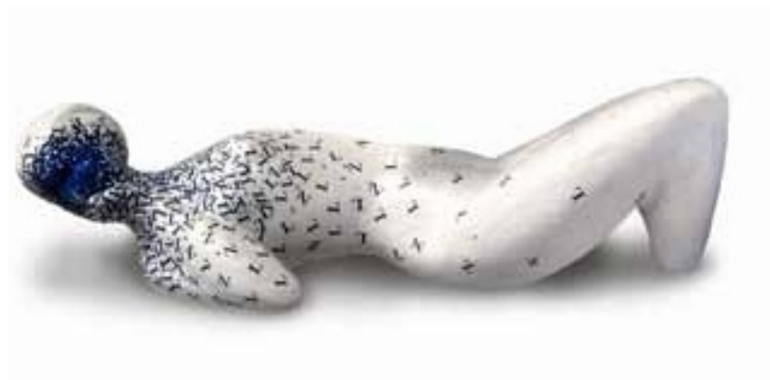
제목 없음, 36x11 cm, 2024

오스트라바의 미술 아카데미에서 그래픽 아트를, 브르노의 공연 예술 아카데미에서 장면 디자인을 전공했습니다. 2010년부터 체코와 슬로바키아에서 주로 연극 시노그래피 작업을 하고 있습니다. 그녀는 오스트라바의 페트르 베즈루츠 극장, 브르노의 후사나 프로바츠크 극장, 국립 극장 브르노, 라도스트 극장, 슈반도프 극장, 그리고 프라하 또는 즐린의 시립극장에서 활동했습니다. 그는 그래픽, 공간 설치 및 드로잉에 중점을 둔 자유 작업을 하고 있습니다.