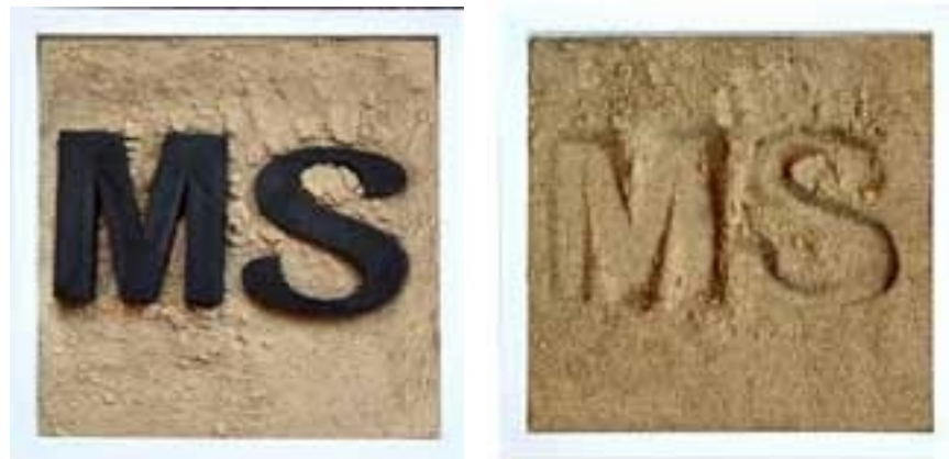
"샌드박스", 26,5x26,5cm 2024

그녀는 카토비체에 있는 실레지아 대학교 예술학부에서 시각예술 예술 교육을 전공했습니다. 그녀는 닥터 허브의 회화 스튜디오에서 졸업장을 받았습니다. 2010년에 아담 몰렌다. 2013년에는 모교에서 박사 과정을 시작했습니다. 예술 작품 외에도 베니스 치친 비엔날레, 베니스 치친 아트 미팅, 시네마 온 더 보더 필름 리뷰를 공동 조직하는 등 문화 보급 분야에서 실질적인 활동을 하고 있습니다. 보다 전문적이고 실용적인 지식을 얻기 위해 2014년부터는 사회문화 애니메이션 분야에서 공부를 시작했습니다. 그녀는 스코초프의 세인트 존 사르칸데르 갤러리, 체스키치에신의 갤러리 모스트와 갤러리 포다, 레그니카의 아트 갤러리, 크라쿠프, 루블린, 체스키치에신의 도시 공간에서 작품을 선보였습니다).