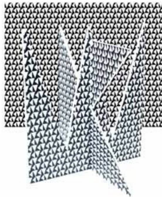
모노그램, 종이에 디지털 프린트, 플라스틱 40x50cm, 2024,