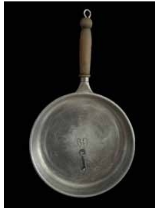
Cieszyn 집 암탉의 자화상, 30x50cm, 2024년