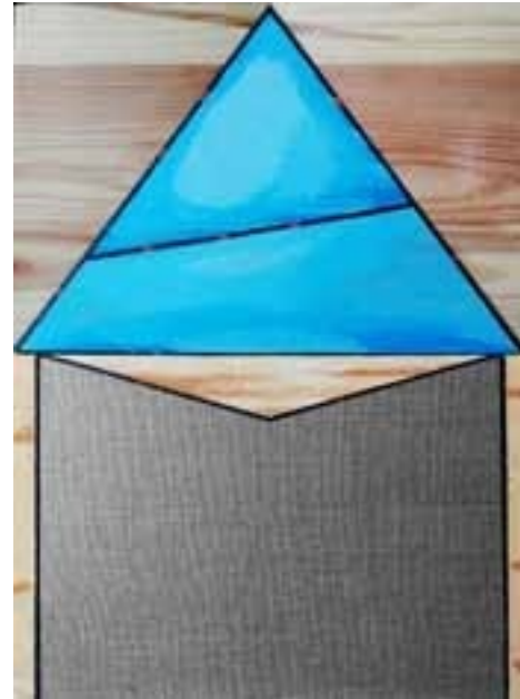
AM - 미묘한 개체, 조립, 오일, 아크릴, 보드, 캔버스, 30x40cm, 2023년 옵션

카토비체의 실레지아 대학교와 크라쿠프의 미술 아카데미를 졸업했습니다. 크라쿠프 미술 아카데미 회화 학부에서 박사 학위와 재할 과정을 마쳤습니다. 현재 실레지아 대학교의 교수로 재직 중이며 치에신에 있는 미술 연구소에서 일하고 있습니다. 회화에 대한 그의 관심은 유럽 전체의 공통 유산으로 간주되는 그리스-기독교 전통에 뿌리를 두고 있으며, 소위 서구 세계의 다양한 지점과 순간에서 그 흔적을 발견합니다. 그는 이러한 문제를 조사하고 보여 주려고 노력합니다.